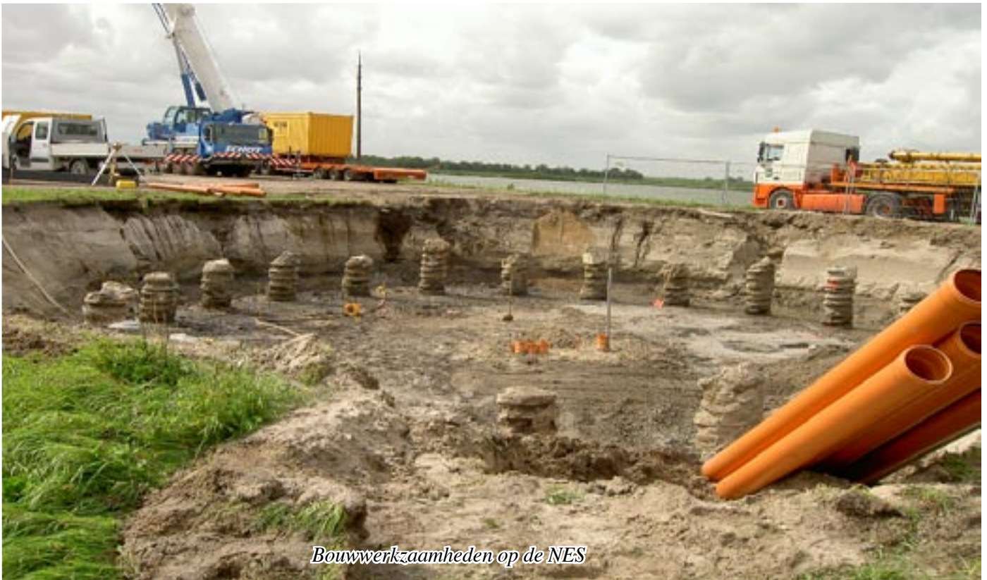
Bouwwerkzaamheden op de NES