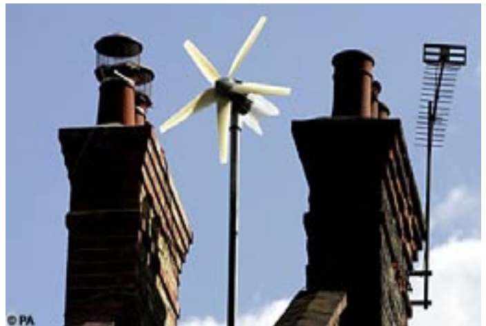
De molen van Cameron

ron, vindt echter dat windturbines wél gezien mogen worden want hij heeft een kleine turbine bovenop z'n monumentale huis laten plaatsen. Een prachtig statement van een politicus en een voorbeeld dat wat mij betreft navolging verdient. Het dak van het Catshuis leent zich namelijk prima voor een molen.